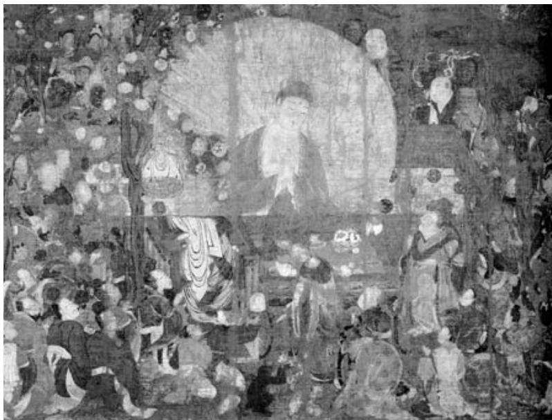
図3 釈迦金棺出現図 京都国立博物館

また、この作品とよく並び称されて論じられる「釈迦金棺出現図」(京都国立博物館、一一世紀後半)(図3)は、悲痛のた