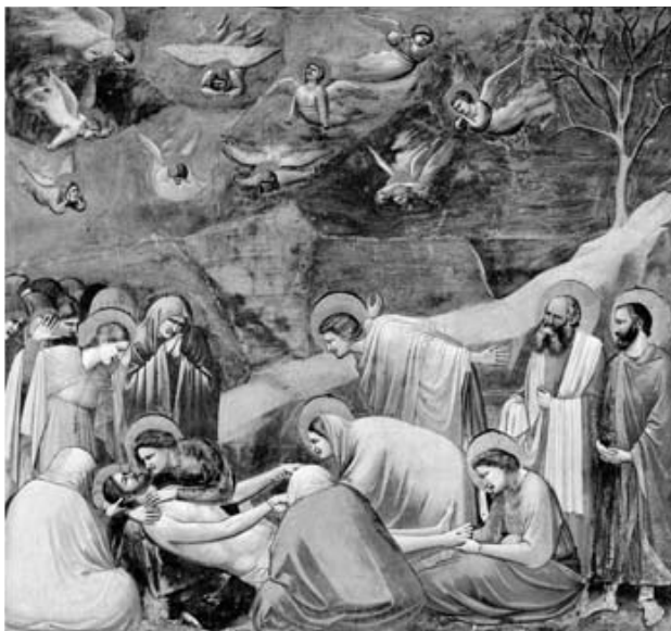
図4 イエスの死の哀悼図 ジョット作 パドヴァ スクロヴェーニ礼拝堂

このしぐさは、香油をイエスの足に塗る女性のエピソード（ルカ福音書7、36〜50）との連想もあると思われるが、イエスへの敬愛の念も込められているように感じられる。画面のほぼ中央で両手を広げて嘆き悲しんでいるのは、福音書記者ヨハネだが、背後の岩の丘の傾斜にそって彼の姿勢と視線が方向づけられている。ニコデモとアリマタヤのヨセフが、右端に立ってこ