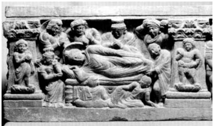
図1 仏涅槃図 ガンダーラ地方出土 個人蔵

ブツダに対して礼拝するしぐさをする大迦葉のこのような役割は、その後の涅槃図では迦葉菩薩の身ぶりに見出されるかも