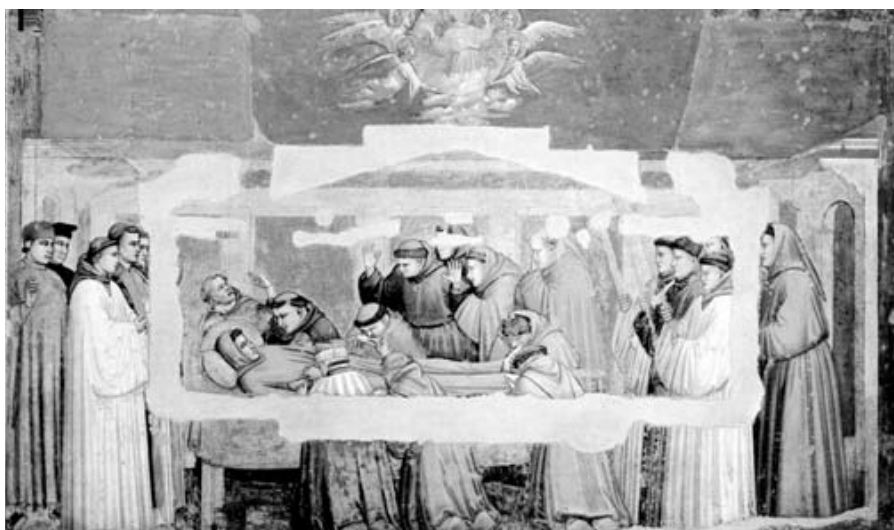
図6 聖フランチェスコの死 ジョット作 フィレンツェ サンタ・クローチェ聖堂

するものである。教団側としては、フランチェスコの死後、彼の思想に基づいて会を存続させていこうとするなかで、フランチェスコをキリストとしてみる見方、つまりフランチェスコ個人は亡くなっても、第二のキリストとして永遠に人々の心に生きるという考えを図像においても主張したといえるだろう。