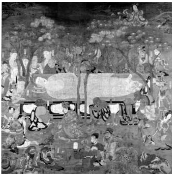
図2 仏涅槃図 高野山金剛峯寺

わが国で現存する最古の涅槃図である高野山金剛峯寺本（応徳涅槃図、一〇八六年）（図2）では、迦葉菩薩は釈迦の枕元宝台の角に手を置いていた弥勒菩薩（慈氏菩薩）のそばで両手