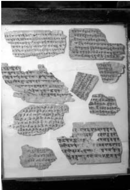
写真3 カーブル博物館に展示されたG洞発見の経片

バーミヤン遺跡の保存・修復の活動は、基本的にこの「ユネスコ文化遺産保存日本信託基金」によって行うことになったのである。9月、私は日本・ユネスコ合同ミッションの一員として、保存計画策定のため、現状調査すべく24年ぶりにバーミヤンを訪れた。