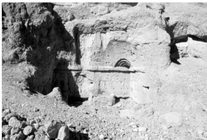
写真4 G洞址 1930年にフランス隊が発掘