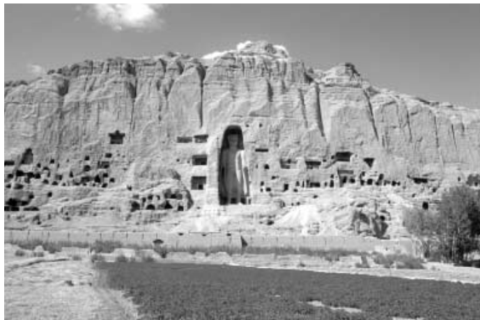
写真1 大仏のある風景(1977年)

タリバン政権の崩壊後、アフガニスタン復興のプログラムの不可欠で重要な項目として、文化復興がかかげられた。2002年1月の東京会議の後、5月、首都カーブルで「アフガニスタン文化遺産復興国際会議」が開催され、この会議の席上で日本政府は、バーミヤンの文化遺産の保存と修復に関してユネスコ(国連教育科学文化機関)に資金を拠出する意向を表明した。こうして、