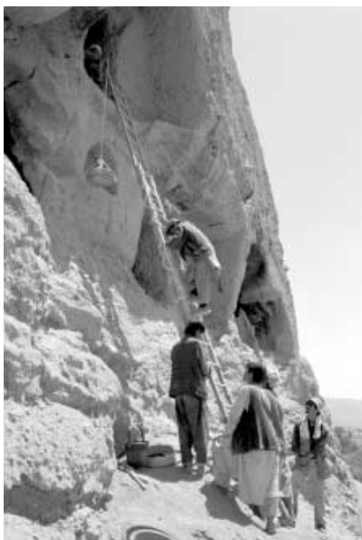
写真10 仏典が発見されたM洞 梯子を使つての作業