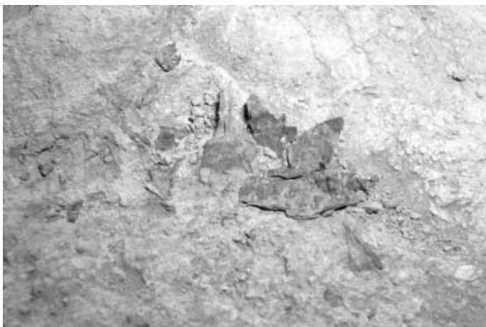
写真13 土中に見える仏典の断片

FとGはフランス考古学隊によって付された記号だが、Mは1969年の名古屋大学の調査によって発見され付された記号である。GとMは石窟の構造は異なっているが独立洞であり、Fは3室よりなる集合洞である。共通してい