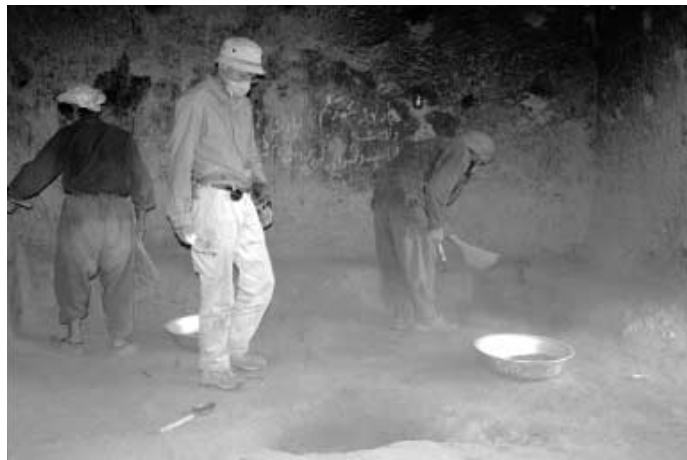
写真8 石窟内の清掃作業