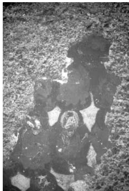
写真11 M洞内の天井に残る壁画