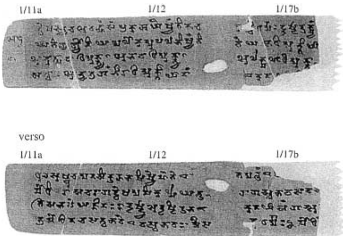
写真6 随説諸法経の一部(スコイエン・コレクション)

て、さらにその奥とっているのではない。バーミヤン遺跡の東西には生活窟はあるが、その奥には石窟の存在はほとんど認められないからである。