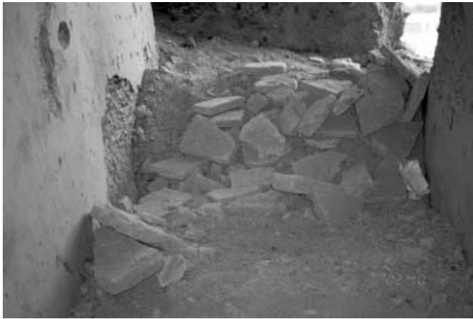
写真5 掘り起こされた床面