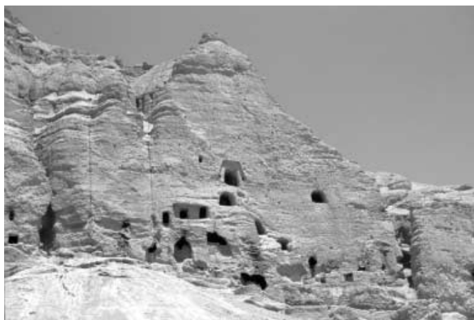
写真12 仏典の断片が発見されたJ洞群

ねばならなかった。私たちはバーミヤンの石窟群を有する3つの摩崖、38メートルの東大仏を中心に刻む東方崖、バーミヤンにおける唯一の未調査石窟群（L洞群）とK洞の名で知られる石窟のある中央崖、55メートルの大仏を西端に刻む西方崖のうち、東方崖の諸窟に絞って作業をおこなった。