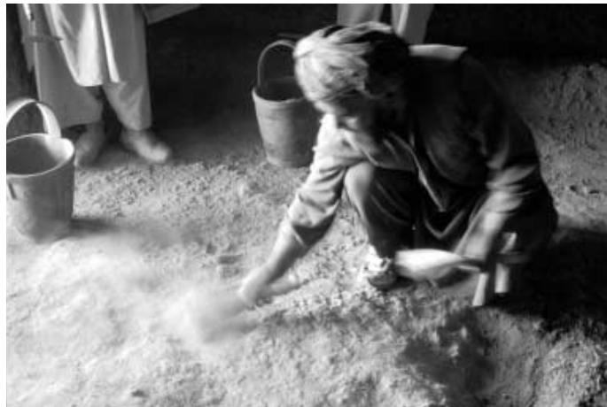
写真7 石窟内の清掃作業

2002年10月、大仏爆破ののち、タリバン政権崩壊のあと、日本・ユネスコ合同調査隊の一員としてパーミヤン遺跡の現状調査をした私たちは、坐仏を安置した仏堂を中心としたいくつかの堂の床がごとごとく掘り返されていたのを目にした(写真5)。おそらくパーミヤンの仏教時代の終末時に床下に埋蔵されたかもしれない経典の探索、盗掘がおこなわれたのであろう。写本の救済というのは盗掘の動機をかくすため難民にかこつけての口実に過ぎない、というのが私の憶測である。