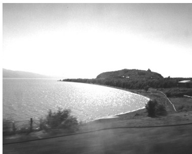
写真01 セヴァン湖