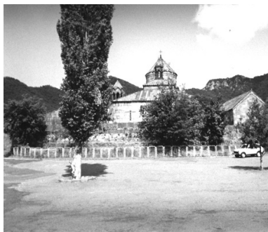
写真02 ハグパット修道院